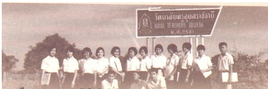
ภาพที่ 4 นักศึกษาวิทยาลัยครูอุบลราชธานี

ปี พ.ศ.2499 กระทรวงศึกษาธิการได้ยุบโรงเรียนสตรีฝึกหัดครูประกาศนียบัตรจังหวัดอุบลราชธานี ไปรวมกับโรงเรียนฝึกหัดครูอุบลราชธานี และปีนี้เองที่โรงเรียนฝึกหัดครูอุบลราชธานีได้เริ่มโครงการฝึกหัดครู ชนบทขึ้น โครงการนี้เป็นโครงการความร่วมมือระหว่างรัฐบาลไทยกับองค์การยูเนสโก (Thailand UNESCO Rural Teachers Education Project หรือ TURTEP) โดยองค์การยูเนสโกได้ส่งผู้เชี่ยวชาญต่างประเทศช่วย ดำเนินการ