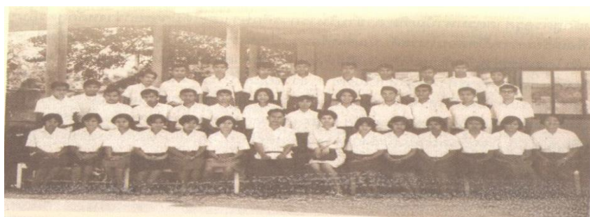
ภาพที่ 3 นักศึกษาวิทยาลัยครูอุบลราชธานี

นอกจากโรงเรียนฝึกหัดครูอุบลราชธานี ซึ่งมีเฉพาะนักศึกษาชายนี้แล้ว จังหวัดอุบลราชธานียังมีโรงเรียนสตรีฝึกหัดครูประกาศนียบัตรจังหวัดอีก 1 โรง ซึ่งเริ่มเปิดสอนตั้งแต่ปี พ.ศ. 2479 โดยสอนหลักสูตร “ประกาศนียบัตรจังหวัด” ปัจจุบันอาคารดังกล่าวอยู่ด้านหลังโรงเรียนอนุบาลอุบลราชธานี