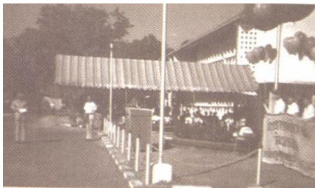
ภาพที่ 5 อาคาร 1 สถาบันราชภัฏอุบลราชธานี

ปี พ.ศ.2547 สถาบันราชภัฏอุบลราชธานีได้เปลี่ยนชื่อจาก “สถาบันราชภัฏ” เป็น “มหาวิทยาลัยราชภัฏอุบลราชธานี” โดยคณะครุศาสตร์ยังคงมีสถานะเป็นองค์กระระดับคณะวิชา