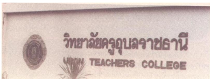
ภาพที่ 1 ป้ายวิทยาลัยครูอุบลราชธานี

คณะครูศาสตร์มีประวัติความเป็นมาพร้อมกับการจัดตั้งมหาวิทยาลัยราชภัฏอุบลราชธานี ทั้งนี้เพราะจุดเริ่มต้นของการจัดตั้งมหาวิทยาลัยราชภัฏอุบลราชธานี คือ การมีโรงเรียนฝึกหัดครูอุบลราชธานี ที่มีประวัติความเป็นมาโดยสังเขป ดังนี้