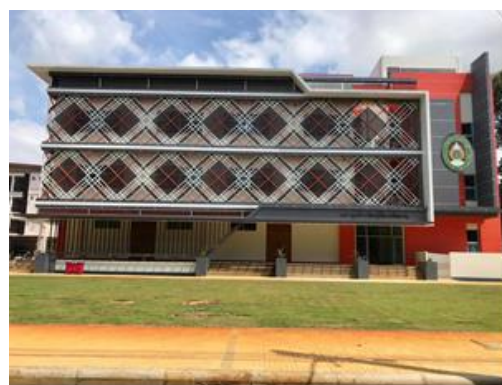
ภาพที่ 6 อาคาร 32,33 คณะครุศาสตร์ มหาวิทยาลัยราชภัฏอุบลราชธานี

2. ปรัชญา วิสัยทัศน์ พันธกิจ ปณิธาน อัตลักษณ์ และประเด็นยุทธศาสตร์