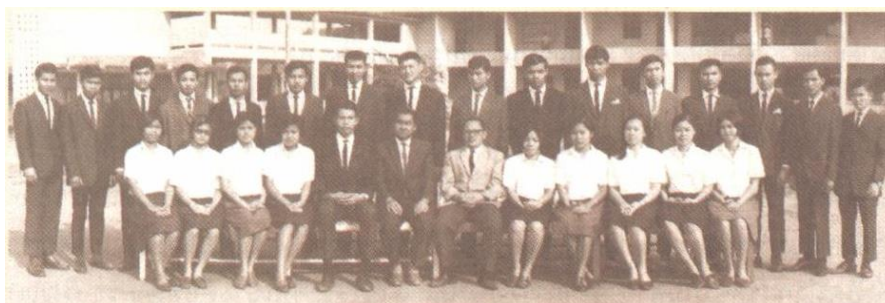
ภาพที่ 2 อาจารย์และนักศึกษาวิทยาลัยครูอุบลราชธานี

ปี พ.ศ. 2489 กระทรวงศึกษาธิการได้อนุมัติให้เปิดสอนชั้นมัธยมศึกษาปีที่ 7 และ 8 เพิ่มขึ้นในโรงเรียนมัธยมศึกษาประจำจังหวัดจึงได้ยุบโรงเรียนเตรียมอุดมศึกษาภาคตะวันออกเฉียงเหนือ